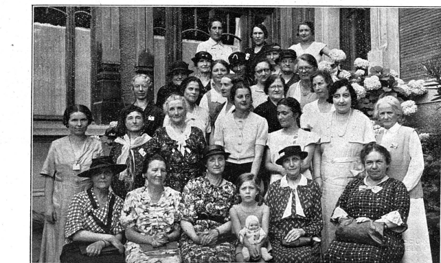
Le Cours de Vacances de Bulle