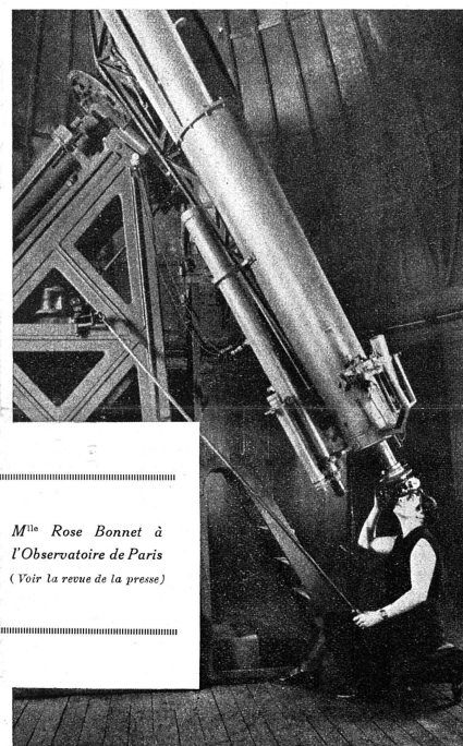
M lle Rose Bonnet à l'Observatoire de Paris (Voir la revue de la presse)