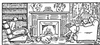
M me BOULARD DEVÈ : Les enfants proscrits