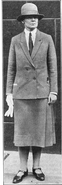
Cliché "The Vote"