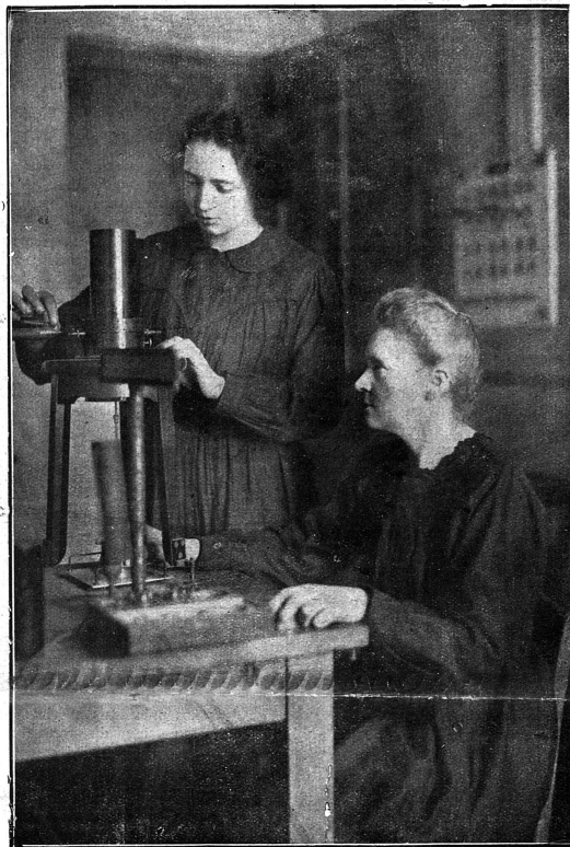
Cliché la « Femme polonoise »