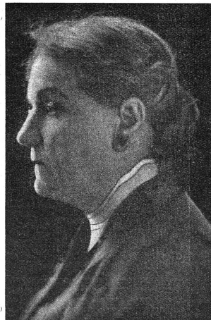
Miss Jane ADAMS