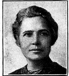
Miss Susan LAWRENCE

Secrétaire parlementaire au Ministère de l'Instruction publique