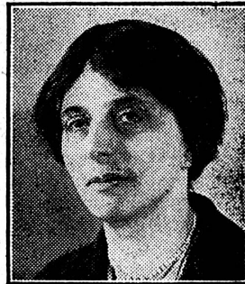
La duchesse d'ATHOLL

Députée au Parlement anglais. - Ex Secrétaire parlementaire au Ministère du Travail.