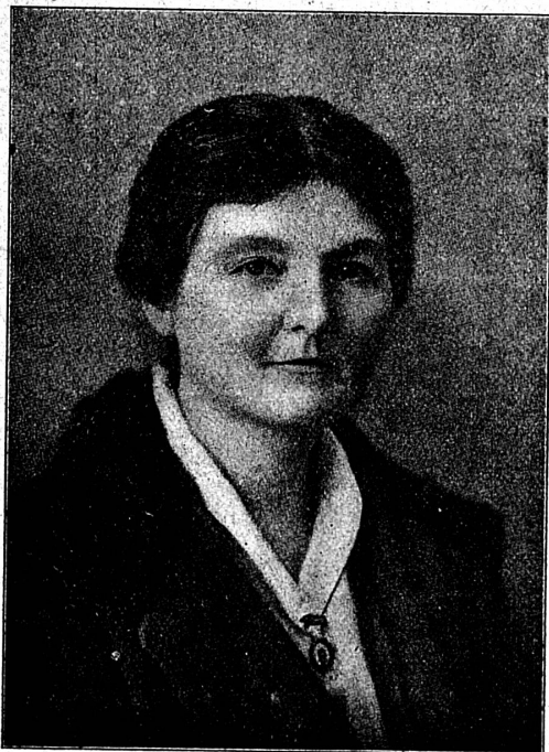
Miss Margaret BONDFIELD

La loi d'émancipation de 1918 a eu pour résultat l'adoption, en deux ans, de plus de lois concernant l'amélioration de la situation des femmes que pendant les vingt années précédentes.