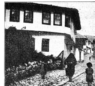
Ancienne maison Bosnienne

Il y a d'abord lieu de tenir compte du fait qu'en Yougoslavie les impôts sont déduits du salaire, qu'on ne paie pas le médecin, ni l'Hôpital, que les vacances sont organisées aux frais de l'Etat. Le salaire net que touchent tous les travailleurs (et l'Etat veille à ce que tous ceux qui sont valides travaillent), ne sert donc qu'au logement, à l'entretien et à l'habillement.