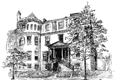
Cliché « Mouvement Féministe »

Siège, en 1927, de la Ligue des Femmes Electrices à Washington