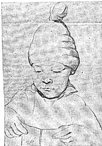
Dessin de Frida Heim