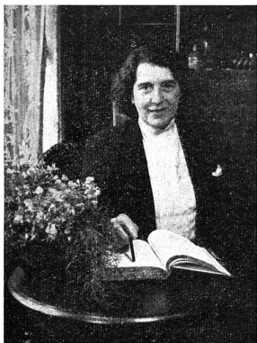
Cliche Mouvement Féministe