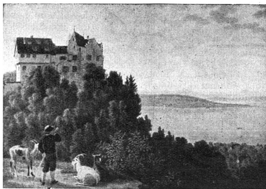
Château de Salenstein

On voit que les buts à atteindre ne manquent pas, que chacun de ces services nécessite des efforts suivis et coûteux. Ne refusez pas votre appui à cette œuvre utile.