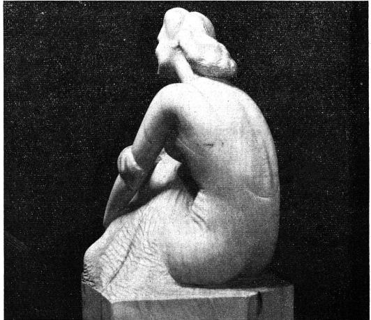
Une grande artiste mi-russe, mi-française Chana Orloff expose actuellement à Genève.

Une longue vie droite, utile et remplie, inspirée par une grande force spirituelle et illuminée par une large et tolérante bonté. Une longue vie dont nous, féministes, n'avons forcément connu que certains des aspects, mais qui s'est épanouie aussi dans un vaste cercle familial de frères et sœurs, de neveux et de nièces, et au premier rang, autour du compagnon de son existence, de sa fille, de son fils, de ses petits-enfants... car c'est à tous ceux-là que nous songeons spécialement, en réalisant la perte qu'ils viennent de faire, et à leur intimité si étroite,