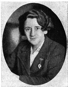
Ellen WILKINSON Ministre de l'Éducation

de la gauche, vingt et une de ces parlementaires sont travaillistes; une est conservatrice (Lady Davidson), une libérale (Miss Megan Lloyd George, la seule et unique femme députée que le Pays de Galles, qui paraît plutôt réfractaire au féminisme, ait jamais comptée jusqu'à présent, et dont la grande popularité est bien connue); et une indépendante (Miss Eleanor Rathbone, la protagoniste des allocations familiales que nous avons bien souvent vue dans nos Congrès comme à la S. d. N. à Genève). Toutes trois ont déjà exercé aux Communes un mandat plus ou moins long, alors que bien des noms dont nous avons reçu de Londres la liste complète sont entièrement inconnus dans les milieux féministes: espérons que ces nouvelles recrues parlementaires se révéleront, à leur tour, des convaincues, à l'exemple de Lady Noel-Buxton et de Dr. Edith Summerskill, qui a toujours fait œuvre féministe utile, dans la précédente Chambre. D'ailleurs cette tendance au renouvellement des Parlements se retrouve un peu partout, et se justifie pleinement — à condition toutefois bien entendu que ne se perde pas l'expérience acquise pour notre cause.