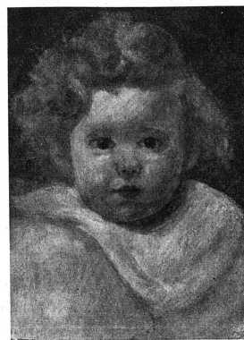
Cliché «Pro Infirmis»

Voici que le printemps nous ramène la vente des cartes de Pro Infirmis — cette vente qui constitue l'essentiel des ressources annuelles de cette œuvre admirable. Grâce à elle, en effet, des êtres qui végéteraient dans l'isolement et dans l'ignorance sont entourés, soignés, réduits: des sourds-muets apprennent à communiquer avec leurs semblables; des aveugles peuvent lire, des épileptiques sont suivis, des arriérés se développent, des infirmes et des estropiés de naissance sont pourvus d'appareils spéciaux... Tous, autant que faire se peut, apprennent un métier adapté à leurs possibilités et qui leur donnera le courage de l'indépendance. Tâche magnifique en vérité que de rendre ainsi à l'existence normale les victimes de la vie: aussi ne pouvons-nous qu'encourager chaudement nos lecteurs à s'associer à l'achat des cartes qui leur seront présentées.