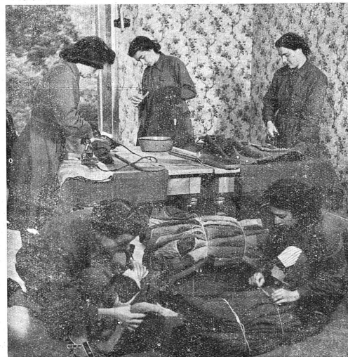
Un atelier du S.C. de nettoyage et d'assortiment des uniformes.