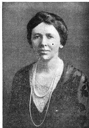
Miss Ruth WOODSMALL (Etats-Unis)

Mouvement de femmes: très vite l'Alliance a senti ses responsabilités à l'égard de toutes les femmes sans distinction de race, de nationalité, de religion ou de condition. C'est pour cela qu'elle a toujours cherché à collaborer avec