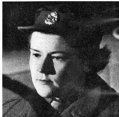
Cliché Mouvement Féministe.

Une autre A. T. S. typiquement anglaise, héroïne du film: «Aux armes! Citoyennes!»