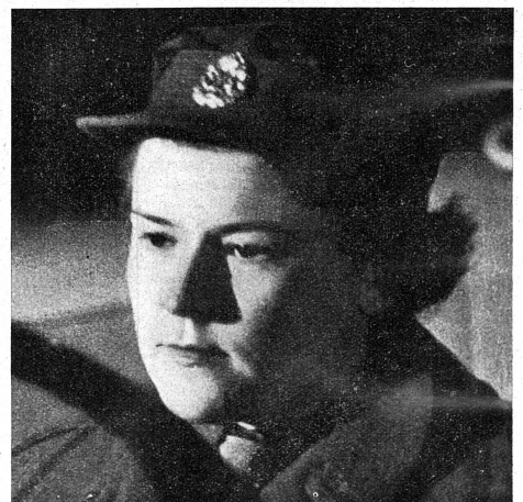
Une autre A. T. S. typiquement anglaise, héroïne du film: «Aux armes! Citoyennes!»