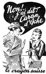
le crayon suisse