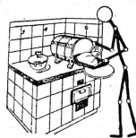
Modèle ancien muni d'appareils qui le rendent d'un usage commode.