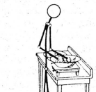
Surélevez-la donc avec un tabouret !