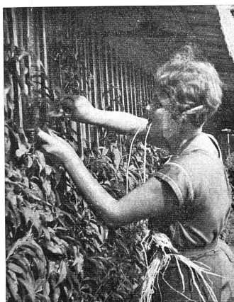
Cliché La Corbière (Estavayer)

Non seulement c'est là l'élément essentiel de la réussite, mais cela permet de surmonter les revers inévitables.