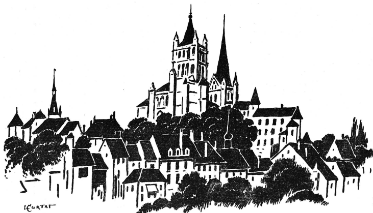
Lausanne — où l'Alliance de Sociétés féminines vient de se réunir, et où nous allons célébrer le 30 e anniversaire de notre journal.