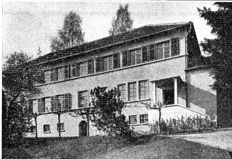
La crèche modèle de Horgen, affiliée avec 61 autres institutions analogues, fondées et dirigées uniquement par des femmes, à l'Association suisse des crèches.