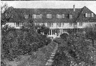
Le „Lindenhof“, maison pour femmes seules professionnellement occupées, construite à Zürich, par l'architecte Lux Guyer. Bâle, Lucerne, Winterthur possèdent aussi des maisons analogues.