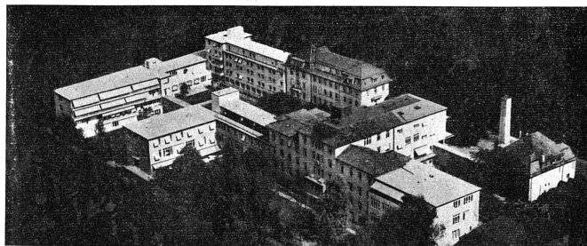
L'Ecole d'infirmières de Zürich, la première du genre en Europe, et qui, dirigée et administrée uniquement par des femmes, a derrière elle 40 ans d'une admirable activité.