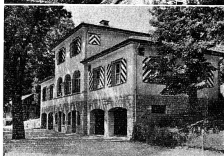
Clichés de la brochure „Femme Suisse“

nous semble par contre inapte à figurer au nombre des principes constitutionnels sur lesquels baser des élections au Conseil fédéral: c'est cette phrase: « il sera tenu compte équitablément des tendances politiques ». Il va sans dire qu'un parti important, constitué sur la base de la démocratie à un droit, et même un devoir incontestable, à prendre sa part des responsabilités gouvernementales. Mais cette disposition devient une épée à double tranchant si d'autres groupements — de droite ou de gauche — opposés au régime démocratique de la Suisse peuvent à l'avenir se réclamer d'un droit constitutionnel pour occuper légalement leur siège dans notre Exécutif.