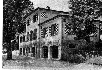
Clichés de la brochure „Femme Suisse“

nous semble par contre inapte à figurer au nombre des principes constitutionnels sur lesquels baser des élections au Conseil fédéral : c'est cette phrase : « il sera tenu compte équitablement des tendances politiques ». Il va sans dire qu'un parti important, constitué sur la base de la démocratie à un droit, et même un devoir incontestable, à prendre sa part des responsabilités gouvernementales. Mais cette disposition devient une épée à double tranchant si d'autres groupements — de droite ou de gauche — opposés au régime démocratique de la Suisse peuvent à l'avenir se réclamer d'un droit constitutionnel pour occuper légalement leur siège dans notre Exécutif.