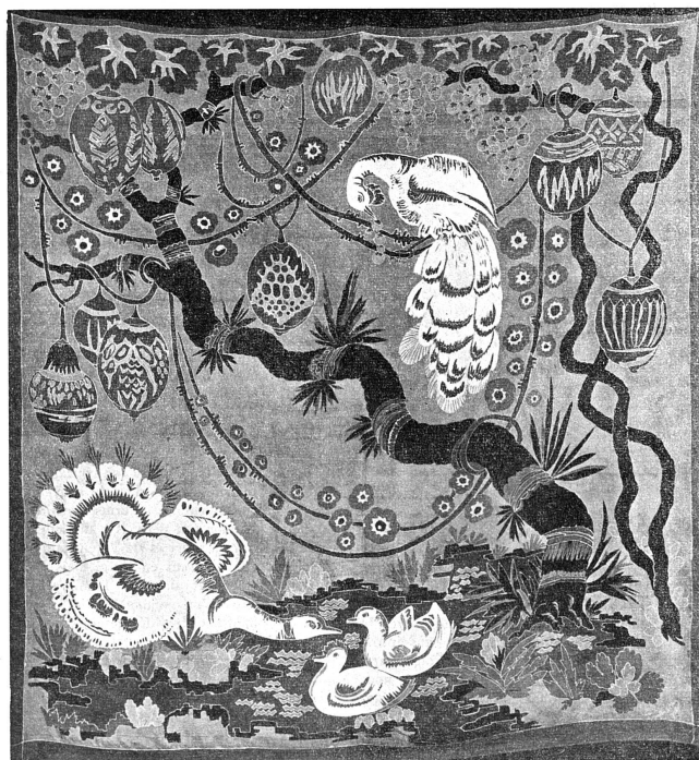
Tenture au Musée de Genève