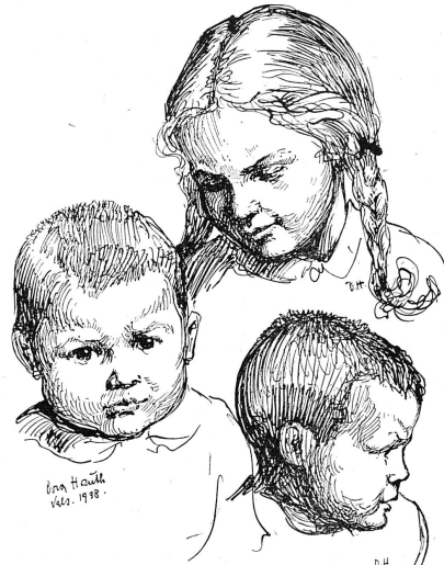
Cliché Pro Juventute

bles de l'alambic pour les réserver à l'alimentation du pays.