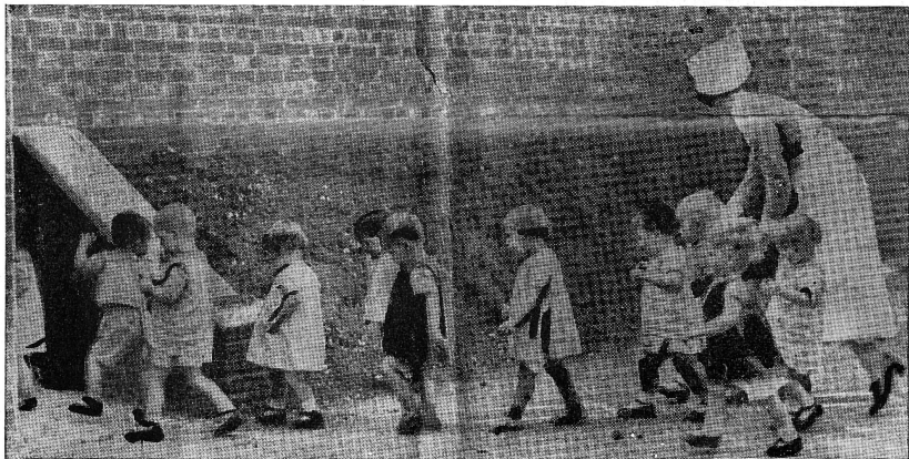
Cliché U. S. E.

celui où se placerait un Suisse romand étudiant ces mêmes rapports. Peut-être le panorama qui se déroule sous nos yeux et qui embrasse la période de 1848 à nos jours n'est-il pas suffisamment situé dans l'histoire des relations morales qui, au cours des siècles, ont préparé l'incorporation des pays romands à la Confédération suisse. Quoi qu'il en soit, ces pages d'un intérêt soutenu et d'une documentation sûre viennent à l'heure où les renseignements qu'elles apportent sont indispensables à tout Suisse cultivé. Elles ne peuvent manquer d'avoir chez nous un grand retentissement.