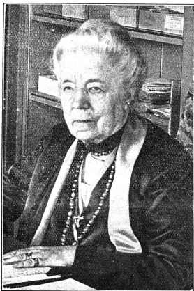
Selma Lagerlöf (1858 - 1940)

Il est sans doute peu d'auteurs contemporains, tant masculins que féminins, dont le nom soit plus connu, l'œuvre plus lue ou traduite en un plus grand nombre de langues, plus abondamment commentée ou évoquée, que ce ne fut le cas pour la grande romancière suédoise, qui vient de s'endormir paisiblement, chargée d'ans et de gloire, dans cette maison familiale de Märbacka, dont sa renommée avait fait un lieu de pèlerinage quasi