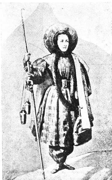
Henriette d'Angeville, « la fiancée du Mont-Blanc », en costume d'alpiniste.

Comme en Occident, les premiers efforts du féminisme oriental naissant se portent sur l'instruction de la jeunesse féminine. La femme veut