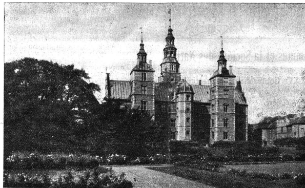
Le château royal de Rosenborg à Copenhague