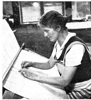
La contrôlease du tissu

(Travail de force musculaire, le poids d'un de ces ballots étant d'environ de 20 kg.)