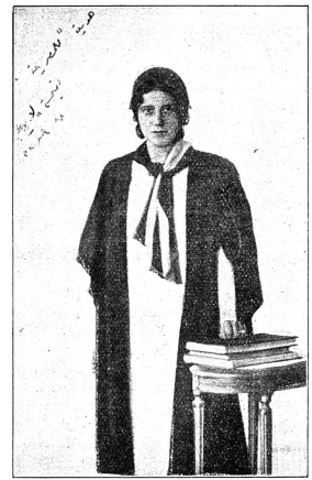
Cliché Mouvement Féministe