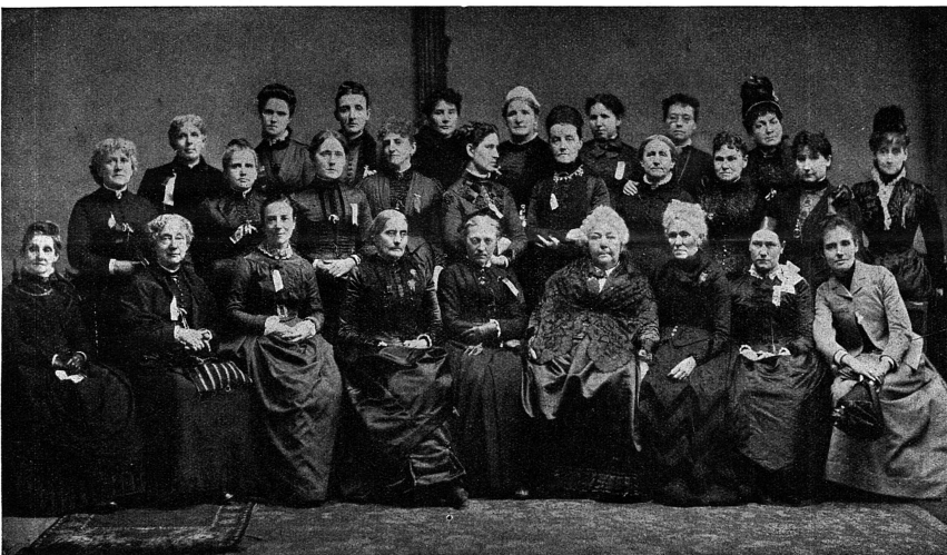
La fondation du Conseil International des Femmes en 1888