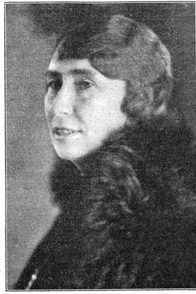
Chloé Mouvement Féministe