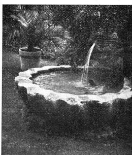
La belle fontaine de la Wegmühle.