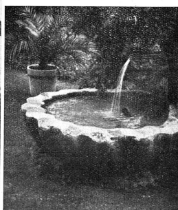
La belle fontaine de la Wegmühle.