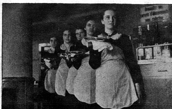
Service aimable, malgré la suppression des pourboires

... Ce n'était pas une gaieté bruyante faite de