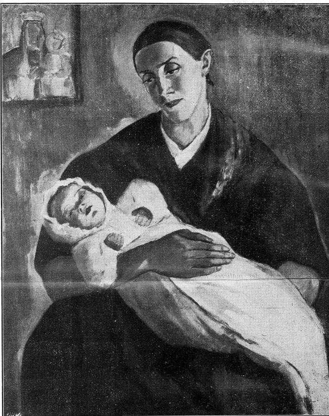
Par Illy Kjaer, artiste autrichienne

Le suffrage et la participation des femmes à la vie publique dans les mêmes conditions que les hommes, doivent lui en assurer la possibilité.