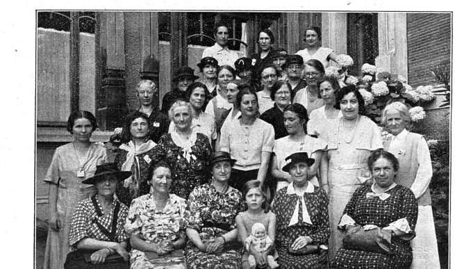
Le Cours de Vacances de Bulle