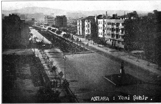
Ankara : La ville moderne