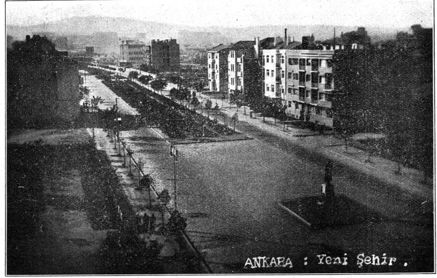
Ankara : La ville moderne