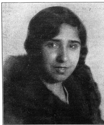
Cliché Jus Suffragist.

...Le résultat positif le plus frappant du Con-