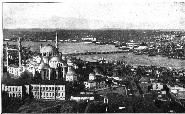
Istanbul, Mosquée de Suleyman et la Corne d'Or

ABONNEMENTS SUISSE . . . . . Fr. 5.— ÉTRANGER . . . . . 8.— Le numéro . . . . . 0.25 Les abonnements partent du 1 er janvier. À partir de juillet, il est différé des abonnements de 6 mois (3 fr.) établis pour la somme de l'année en cours. ANNONCES La ligne ou son espace : 40 centimes Réductions p. annonces répétées