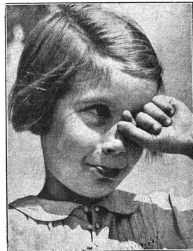
Cliché Mouvement Féministe (d'après „Die Frau in der Schweiz“)

Dédié à toutes les féministes qui réfléchissent!