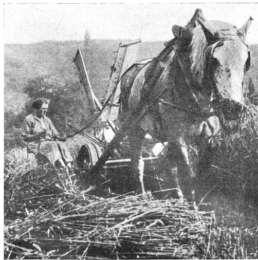
La moderne Cérés

En cette période où les attaques contre le travail et le gain des femmes vont se multipliant, nous avons pensé intéresser nos lecteurs en illustrant ce numéro de fin d'année par quelques clichés montrant différents aspects du travail féminin.