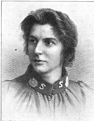
La nouvelle «Générale» Evangéline BOOTH dans sa jeunesse.

Auteur de plusieurs livres, musicienne, compositeur, orateur, la générale est docteur ès lettres. A l'occasion des services qu'elle a rendus pendant la guerre, elle a été décorée par le Président des Etats-Unis. Elle est très populaire en Amérique.