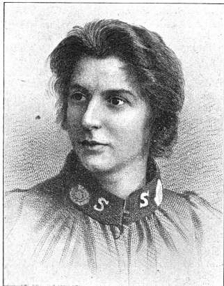
La nouvelle «Générale» Evangéline BOOTH dans sa jeunesse.

Auteur de plusieurs livres, musicienne, compositeur, orateur, la générale est docteur ès lettres. A l'occasion des services qu'elle a rendus pendant la guerre, elle a été décorée par le Président des Etats-Unis. Elle est très populaire en Amérique.