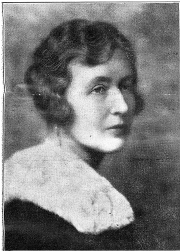
Cliché „The Vote“