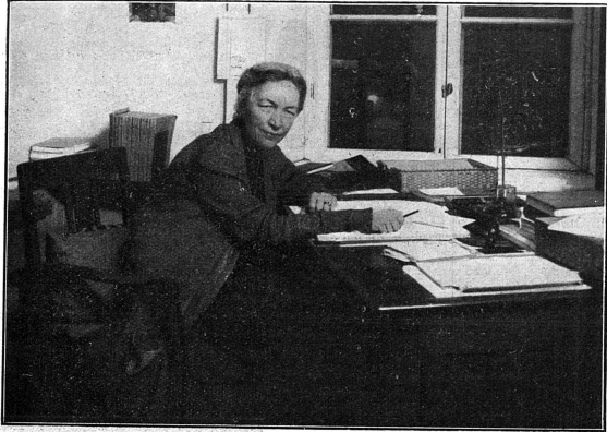
Mlle Kerstin HESSELGREN (Suède)

sénateur, inspectrice du travail, qui préside avec clarté et savoir-faire la V e Commission de l'Assemblée (questions sociales et humanitaires).